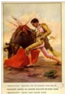
José Mª de Cossío

Exposiciones bibliográficas • Dedicadas a autores tan variados como al primer premio Nobel español, José Echegaray