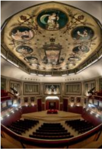
Salón de Actos