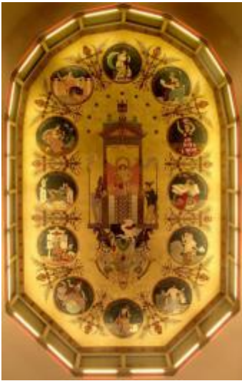
Techos del Salón de Actos